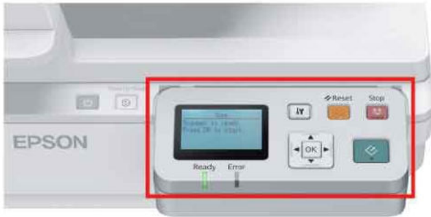
ตั้งทำได้ง่ายด้วยภาพ LCD บนเพาเวอร์ไลน์ต่อการทำงานกับเครือข่าย

ด้วยเพาเวอร์ไลน์ต่อการทำงานกับเครือข่าย (อุปกรณ์เสริม) สแกนเนอร์สามารถใช้งานร่วมกับ Work Group โดยไม่จำเป็นต้องเชื่อมต่อ USB ผู้ใช้สามารถเลือก PC ที่ต้องการถ่ายโอนข้อมูลไปยัง Document Capture Pro Application ที่ติดตั้งใน Client PC หรือ Server PC