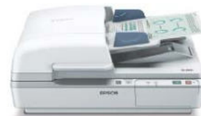
WorkForce DS-6500 25ppm/50ipm

สแกนเนอร์ WorkForce ขนาด A4 รุ่นใหม่ล่าสุดจากเอปสัน ให้คุณภาพมากขึ้นและเชื่อถือได้ ด้วยอุปกรณ์ป้อนเอกสารอัตโนมัติถึง 100 แผ่นในตัวเครื่อง มีอัตราการสแกนสูงถึง 3,000 หน้าต่อวัน สำหรับรุ่น DS-6500 และ 4,000 หน้าต่อวัน สำหรับรุ่น DS-7500 ให้ประสิทธิภาพการสแกนที่เร็วสุดถึง 40 หน้าต่อนาที/80 กวต่อนาที สำหรับรุ่น DS-7500 ในตัวสแกนเนอร์ประกอบด้วย Document Capture Pro Software ซึ่งมีฟังก์ชันสแกนเพื่อพิมพ์, สแกนจากออนไลน์ ฮับส์ และ FTP เพื่อให้การจัดการเอกสารทำได้อย่างรวดเร็วและง่ายดาย