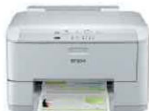
WorkForce Pro WF-4011

ปรับปรุงผลงานของคุณด้วยเครื่องพิมพ์ที่รองรับเครือข่าย WorkForce Pro WF-4011 ให้คุณทำพริ้นด้วยค่าใช้จ่ายในการพิมพ์ที่ถูกลง