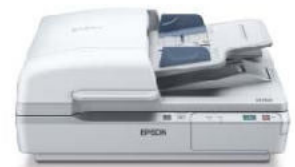
WorkForce DS-7500 40ppm/80ipm