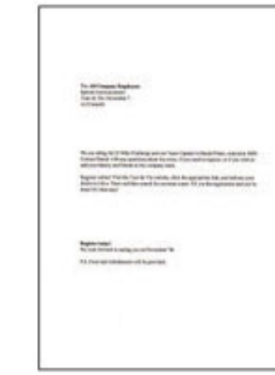
#1 ข้อความสีดำ และกราฟิก

*1 ความเร็วการพิมพ์ (หน้าต่อนาที) คำนวณจากการพิมพ์แบบกระดาษธรรมดา A4 ไม่หนืดที่เร็วที่สุด ความเร็วในการพิมพ์อาจแตกต่างกันไปขึ้นอยู่กับวิธีการกำหนดค่าของระบบ, โหมดการพิมพ์, ความซับซ้อนของเอกสาร, ซอฟต์แวร์, ประเภทของกระดาษที่ใช้ และการเชื่อมต่อ ความเร็วในการพิมพ์โดยรวมเวลาประมวลผลของคอมพิวเตอร์เครื่องที่ส่งพิมพ์