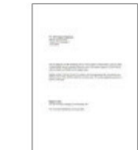
#1 ข้อความสีดำ

*1 ความเร็วการพิมพ์ (หน้าต่อหน้า) คำนวณจากการพิมพ์บนกระดาษธรรมดา A4 ในโหมดที่เร็วที่สุด ความเร็วในการพิมพ์อาจแตกต่างกันไปขึ้นอยู่กับข้อกำหนดของระบบ, โหมดการพิมพ์, ความซับซ้อนของเอกสาร, ซอฟต์แวร์, ประเภทของกระดาษที่ใช้ และการเชื่อมต่อ ความเร็วในการพิมพ์โดยรวมเวลาประมวลผลของคอมพิวเตอร์เครื่องที่สั่งพิมพ์