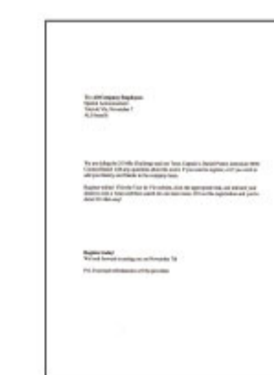
#1 ช่องกระดาษ แลกรางพิมพ์

*1 ความเร็วการพิมพ์ (หน้าต่อนาที) คำนวณจากการพิมพ์แบบกระดาษธรรมดา A4 ในโหมดที่เร็วที่สุด ความเร็วในการพิมพ์อาจแตกต่างกันไปขึ้นอยู่กับข้อกำหนดค่าของระบบ, โหมดการพิมพ์, ความซับซ้อนของเอกสาร, ซอฟต์แวร์, ประเภทของกระดาษที่ใช้ และการเชื่อมต่อ ความเร็วในการพิมพ์โดยรวมเวลาประมวลผลของคอมพิวเตอร์เครื่องที่ส่งพิมพ์